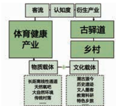
图2 体育健康产业与古驿道复兴及乡村振兴交互关系示意图