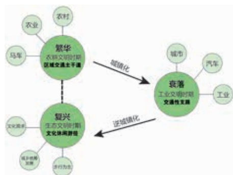
图1 古驿道发展历史轨迹模式图

南粤古驿道定向大赛设置了专业、公开、体验及村民等组别,多样化分组扩大了群体的覆盖,体现竞技与普及的特点。2017年韶关市仁化县石塘古村举行了手机定向活动和“仁爱之城夜光定向活动”,参加该活动的运动员、体验者、古村村民多达1500人,带动人群3000余人 [6] 。随着赛事影响力的扩大,2019年定向大赛参赛人数大幅增加,吸引了37个国家及地区共6497人参赛,带动15万人,间接影响5.7亿