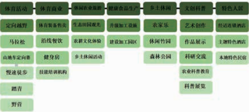
图3 体育健康—文化旅游产业链

以广东梅州东江—韩江古道沿线村庄为例，以举办驿道活动、历史文化庆典为契机，改善周边村落基础设施，扩大服务范围，沿线村落的生活和旅游服务水平得到提升，已初步形成了多层级服务体系。目前沿