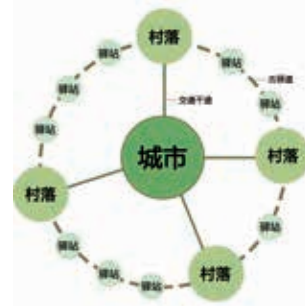
图6 服务体系结构图